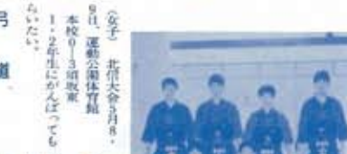
岡谷市民体育館で