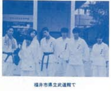
横井市県立武道館で